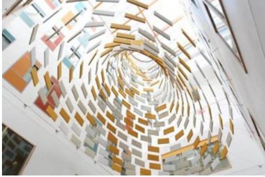
صورة (9) توضح استخدام وحدة فنية معلقة بالسقف لعمل جذب للمتريدين علي المكان

عادة ما توضع الأعمال الفنية في نقاط إستراتيجية Focal Point بحيزات المستشفى وتحظى بالإضاءة الكافية لتكون عنصراً جذاباً؛ ففي مستشفيات الطب النفسي التصميم الداخلي للحيزات يكون له نفس طابع تصميم المنزل. (11)(ص150).