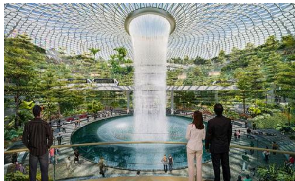
صورة (4) توضح استخدام عنصر الماء كتكوين معماري لجذب الانتباه