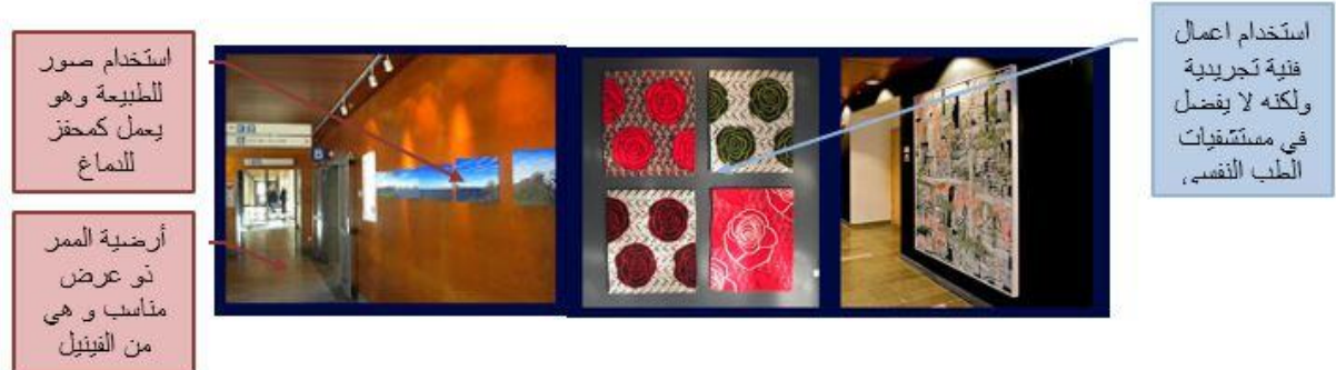
صورة: توضح شكل الممرات في المستشفى