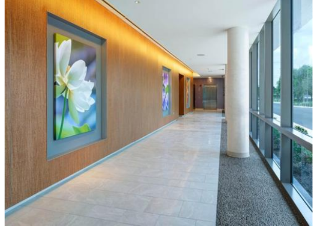
صورة (6) توضح ممر حركة مؤدي الي قسم اخر من اقسام المستشفى